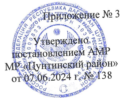
ГРАФИК приемки образовательных учреждений МР «Цунтинский район»